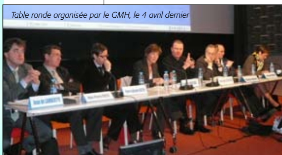
Table ronde organisée par le GMH, le 4 avril dernier

contraintes restent fortes : la réglementation du code du Patrimoine qui se durcit, les normes de sécurité renforcées et peu compatibles avec le statut de monument historique, ou encore les obligations d'accessibilité légitimes mais non financées à ce jour.»