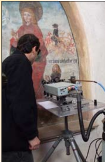
Analyse stratigraphique par spectroscopie

Aujourd'hui, vous pouvez disposer d'analyses des matériaux, sur n'importe quel support, in situ et en direct. Grâce au LIBS (spectroscopie d'émission optique sur plasma induit par laser), on focalise un tir de lumière qui pénètre le matériau à une profondeur de 5 à 10 microns. L'impulsion répétée en un même point permet une analyse stratigraphique instantanée. Cette technique quasiment non destructive permet une étude en finesse, notamment à des endroits interdits de prélèvements. Le matériel est presque opérationnel, reste à le compacter et à le rendre économiquement viable. C'est l'objectif que s'est fixé le CRITT Matériaux Alsace avec ses partenaires. Mais imaginez que grâce à cette innovation vous pourrez facilement cartographier les états d'interventions d'une œuvre à restaurer !